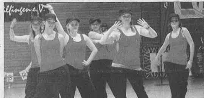
Die »Hip Hop Goldies« kamen in Rot und überzeugten mit ihrer Choreographie.

Die »Hip Hop Minis« (oben) und die Allerjüngsten des Turnerbundes Tailfingen hatten besonders viel Spaß bei ihren Darbietungen bei der Jahresfeier.